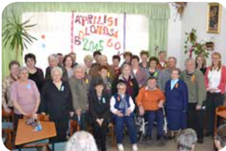
Áprilisi bolonságok - Tréfás vetélkedő