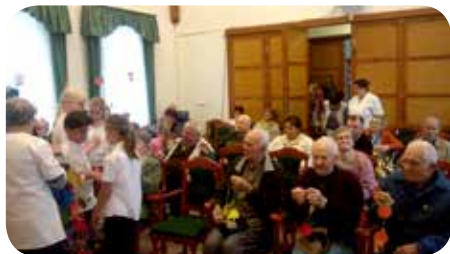
A Gárdonyi Zoltán Református Általános Iskola és Alapfokú Művészeti Iskola tanulóinak műsora